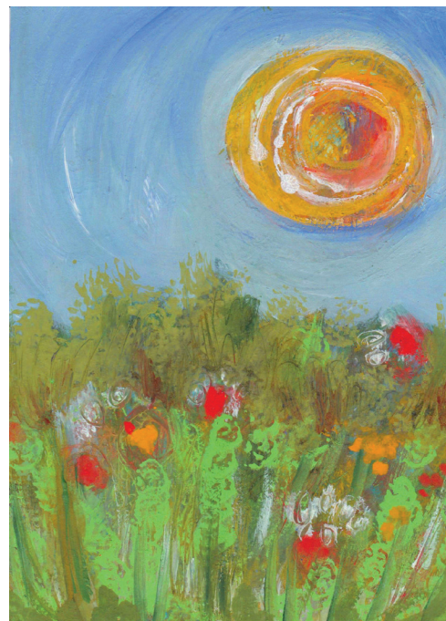
Pastel réalisé par Fanette Olislaeger.

« C'était un mystique et un pèlerin qui vivait avec simplicité et dans une merveilleuse harmonie avec Dieu, avec les autres, avec la nature et avec lui-même. En lui, on voit jusqu'à quel point sont inséparables la préoccupation pour la nature, la justice envers les pauvres, l'engagement pour la société et la paix intérieure. » Pape François (Laudato si, n°10)