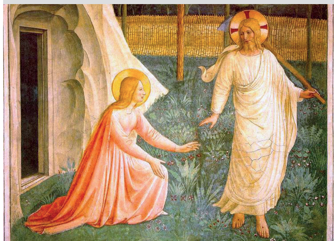
« Nolite me tangere » - Fra Angelico

Dieu, toi le Jardinier patient, apprends-moi à ne jamais désespérer ni de moi ni des autres. Fais que je soigne mon jardin. Fais que mes efforts s'orientent surtout vers les fruits qui nourrissent. Toi le jardinier respectueux apprends-moi à regarder au cœur, là où monte la sève nourricière, là où le fruit s'abreuve dans l'ombre du mystère, derrière l'écorce rugueuse et opaque de nos limites humaines. Amen