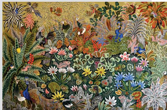
Tapiserie de Dom Robert (© Abbaye d'En Calcat) - « Les enfants de lumière » (carton de 1968).